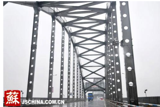
(d)江西九江长江大桥