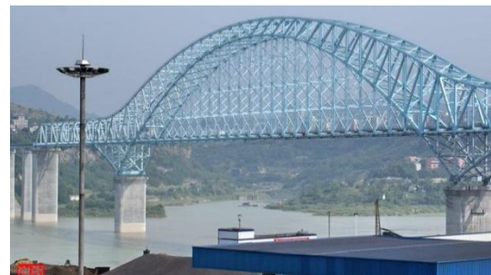
(b)重庆宜万铁路万州长江大桥