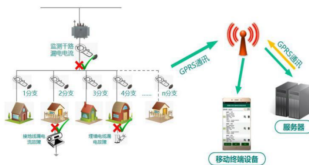
图 2 漏电电流排查装置的技术方案

如图 2 所示，漏电电流采集器通过 GPRS 通讯将测量的数据传至云端服务器；移动终端设备通过网络访问云端服务器，读取采集器测量到的数据，并发送控制指令通过服务器传至采集器；如果出现有漏电电流超限，云端服务器会有报警信息传至移动终端显示，还可以通过短信方式通知相关工作人员。